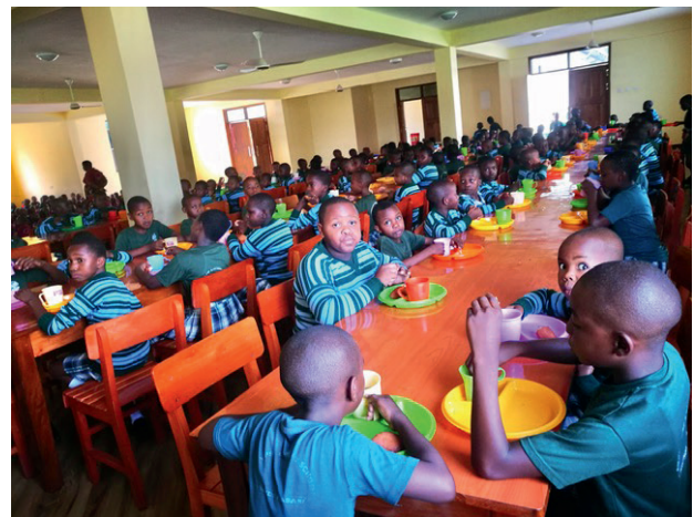
Mensabetrieb in der Abbey Pre & Primary School

Die von der Abtei geführten Bildungseinrichtungen sind staatlich anerkannte Privatschulen, deren Besuch mit Schulgeld verbunden ist, das nicht von allen Eltern aufgebracht werden kann. Der Freundeskreis unterstützt daher bedürftige junge Menschen. 2021 gingen Stipendien an 9 Oberschüler, 8 Mädchen und Jungen der Vor- und Grundschule sowie an 10 Azubis im Berufsbildungszentrum.