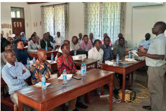
Lehrerfortbildung 2021 im Institut Zakeo Ndanda

mit diesem Osterbrief möchten wir Sie wieder aktuell über die Entwicklung unserer Bildungsprojekte in der Abtei Ndanda informieren. Im vergangenen Jahr gingen mehr als 350 Spenden für Bildung von Tansania auf unser Konto ein. Zusammen mit einer ganz besonderen Einzelspende konnten wir 2021 damit das größte Spendenvolumen seit Beginn unserer Aktivitäten in Projekte umsetzen. Herzlichen Dank dafür!