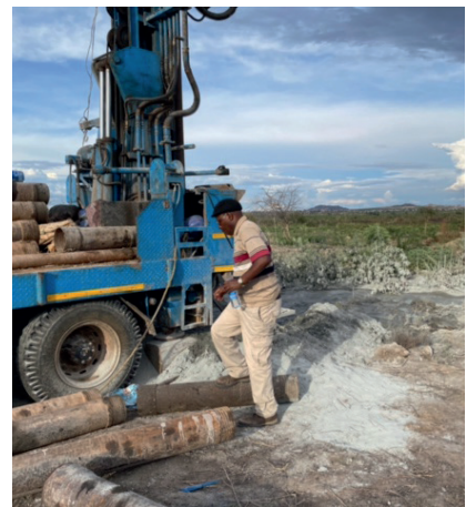
Wasser für die Missionsstation