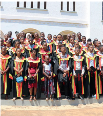
Abschluss Berufsausbildung 2021