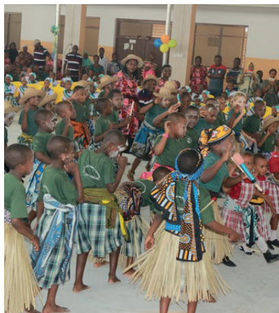
Schulfest in der neuen Aula 2021