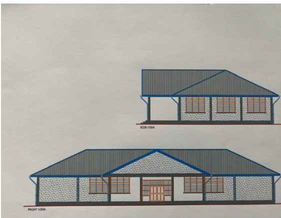
Neubau für das Berufsbildungszentrum 2022

Die Förderung der Berufsausbildung hat für den Freundeskreis eine zentrale Bedeutung. Zur Finanzierung der neuen Klassen- und Büroräume im Berufsbildungszentrum übernehmen wir 50% der Investitionskosten. Der Baubeginn ist im Sommer dieses Jahres.